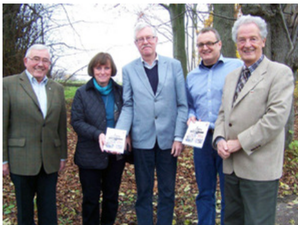
Nov. 2012: Präsentation des Jahrbuchs 2013 durch den Heimatbund Stormarn und den M+K HANSA VERLAG GmbH

Der 31. Jahrgang enthält u.a. Arbeiten über das Cisterzienser-Kloster Reinfeld, das Schloss Ahrensburg und die Villa Wulfriede in Großhansdorf. Ein wichtiger Artikel befasst sich mit dem Limes Saxoniae. Der Autor weist nach, dass die bisher übliche Zeitstellung falsch ist. Friedrich Bölck war ein berühmter Oldesloer, der aus einfachen Verhältnissen zum Großkaufmann wurde. Sein Leben wurde erstmalig nachgezeichnet. Die Geschichte der Stormarnschen Schweiz als Naherholungsregion ist Thema eines weiteren Beitrags. Weitere Artikel zur Geschichte und Kunstgeschichte sowie Unterhaltendes und Plattdeutsches runden den Band ab.