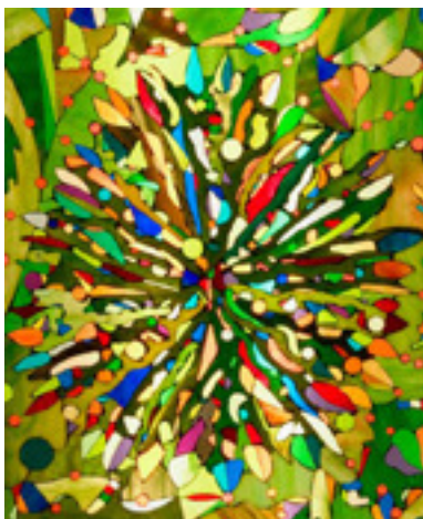
Abbildungen: Glasbild „Das blaue Schloss“; Lichtsäule „Fantasia“, Detail (Dieter Geike)

Der Werkstattbesuch beginnt um 14.00 Uhr in Bad Oldesloe, Kneeden, an der B75 Richtung Reinfeld. Die Teilnahme ist kostenlos. Anmeldung unter Tel. 04532-7797.