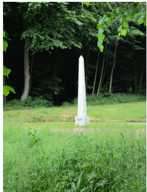
Abbildungen: Stich des Jersbeker Barockgartens; Obelisk im Park am achteckigen Wasserbecken, Foto Klaus Schröder.

Unabhängig davon weisen wir darauf hin, dass auch jetzt der Park offen steht und gerade in der jetzigen Situation gern besucht wird, ein Besuch, der sich zu jeder Jahreszeit lohnt. Ein Flyer und verschiedenen Informationstafeln vor Ort laden ein zu historischen Entdeckungstouren im Zusammenspiel von Natur und Gartenkunst. Nähere Informationen unter www.jersbeker-park.de .